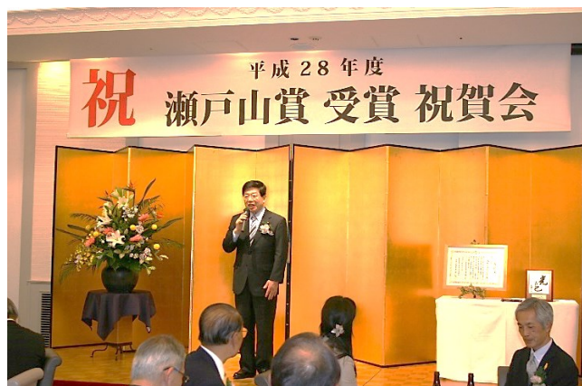
衆議院議員 平口洋様 祝辞