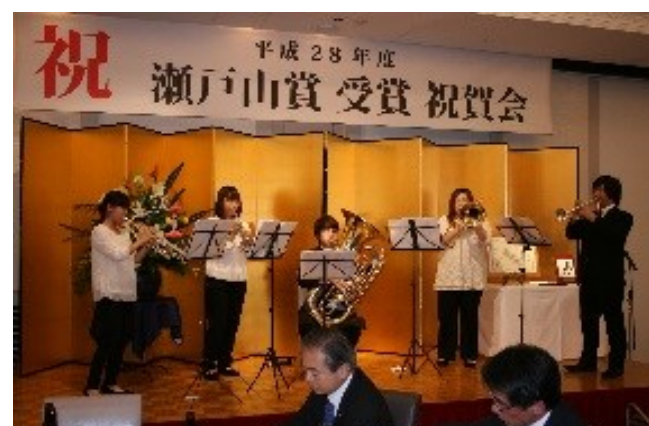
エリザベト音楽大学「HappyPlyers」による金管五重奏